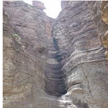
La Garganta del Diablo