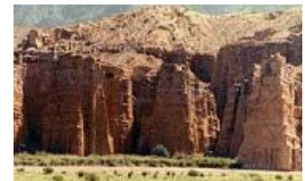
LOS CASTILLOS (Quebrada de Cafayate)