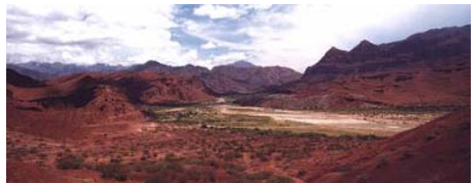
Panorámica desde Tres Cruces (Ruta a Cafayate)