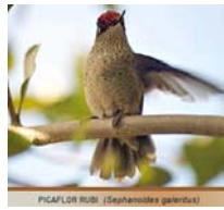
PICAFLORES RUBÍ (Seyhanoides gairdneri)