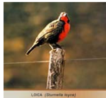
LOICA (Zonotrichia leucophrys)