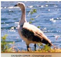
CAUQUÉN COMÚN (Cygnus arcticus)